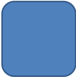
Sayın Soner Özbey