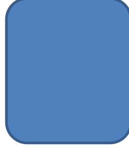
Sayın Burhan Perk