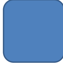
Sayın Nuran Ketenci